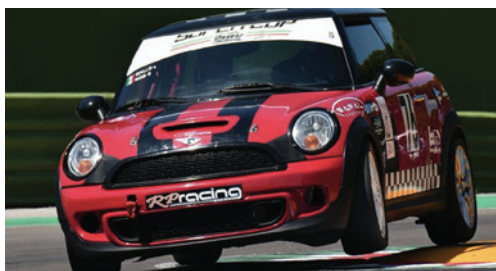
Stefano BOSI (Carabinieri ©) 4° di classe oltre 1600cc - 7° assoluto nel 18° Challenge Velocità Polizia