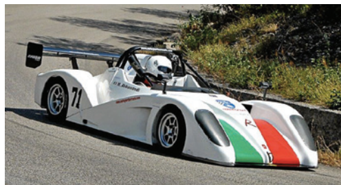
Massimiliano ABBAMONDI (Guardia di Finanza) 3° di classe entro 1600cc - 6° assoluto nel 18° Challenge Velocità Polizie