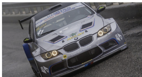
Abramo ANTONICELLI (Guardia di Finanza AN) 2° di classe oltre 1600cc - 4° assoluto nel 18° Challenge Velocità Polizie