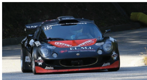
Giuseppe AGNELLO (Carabinieri BO) 3° di classe oltre 1600 cc – 5° assoluto nel 18 Challenge Velocità Polizie