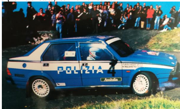
Nicola TAGLIAPIETRA /Paolo SOLLAZZO (Polizia di Stato) Scuderia FIAMME ORO

1989 – la 3ª edizione del Rally fu inserita nel Rally di Roma e vide vincitori l'equipaggio della Polizia composto da Nicola TAGLIAPIETRA / Paolo SOLLAZZO (Polizia di Stato) su Alfa Romeo 75.