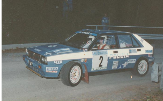
Valter VENTURI / Giorgio NARDIN della Scuderia Fiamme Oro .

Vincitori del 6° Rally Polizie Europee risultano Valter VENTURI / Giorgio NARDIN della Scuderia FIAMME ORO .