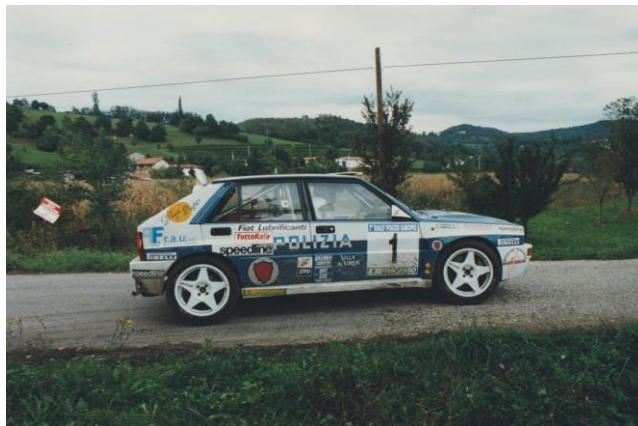
Vittorio GOMBOSO - Oriella TOBALDO Scuderia Fiamme Oro Equipaggio 2° assoluto al Rally delle Polizie Europee 1991

Nello stesso 1991 alcuni piloti dell'Auto Club Nazionale delle Forze di Polizia partecipano nel Formula Rally al MOTOREXPORACING di Gorizia ove il 3 novembre e Desiderio FANTIN vince su Gianluca CALZOLARI . (Polizia Municipale)