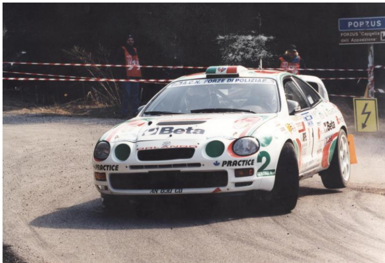
Paolo DAINESI (Polizia di Stato) / Fabio DONINI (Simpatizzante) Sc. Acn Forze di Polizia

Il 1998 vede la 12 a edizione del Rally ottenere la promozione quale gara valida per la Coppa Italia della 4 a Zona CSAI . Organizzata con partenza e arrivo a Gemona assume la denominazione 12° RALLY POLIZIE EUROPEE - PREALPI GIULIE . La vittoria assoluta di questa edizione valida per la Coppa Italia viene conquistata dall'equipaggio della Polizia di Stato composto dal pilota Paolo DAINESI (Polizia di Stato) navigato dal simpatizzante Fabio DONINI su Toyota Celica 205 GT Four gruppo A/6, per i colori dell' ACN FORZE DI POLIZIA vincono anche il Challenge delle Polizie .