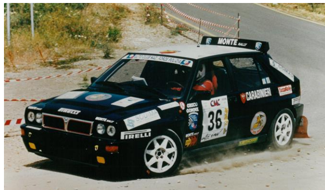
Nel 2006 la partecipazione di Nunziato SETTIMO (Carabinieri) su Delta e livrea Carabinieri Scuderia Acn Forze di Polizia