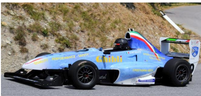
Graziano BUTTOLETTI (Polizia di Stato)

3° Alfredo CALI' su Peugeot 205 rally E3 A 1300