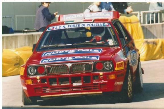
Desiderio FANTIN (Polizia di Stato) Scuderia Acn Forze di Polizia

Nello stesso 1991 alcuni piloti dell'Auto Club Nazionale delle Forze di Polizia partecipano nel Formula Rally al MOTOREXPORACING di Gorizia ove il 3 novembre e Desiderio FANTIN vince su Gianluca CALZOLARI . (Polizia Municipale)