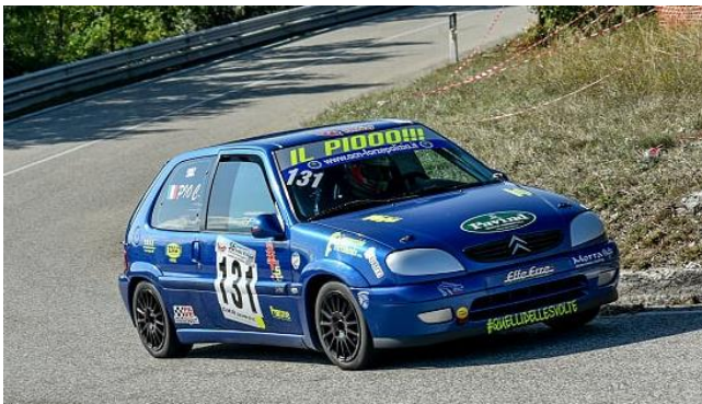
2° Claudio PIO (Guardia di Finanza)