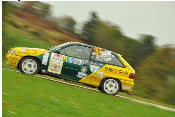
1° Marco CROZZOLI (Polizia di Stato) / LUKI (Simpatizzante) Scuderia Acn Forze di Polizia

Il 22° Challenge internazionale Rally Polizie: